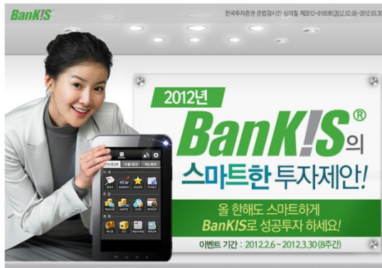
이벤트 내용 고지