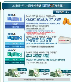
KINDEX 관련 이벤트 혜택 고지