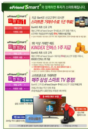
모바일 트레이딩 신규 회원 가입시 이벤트 혜택 고지