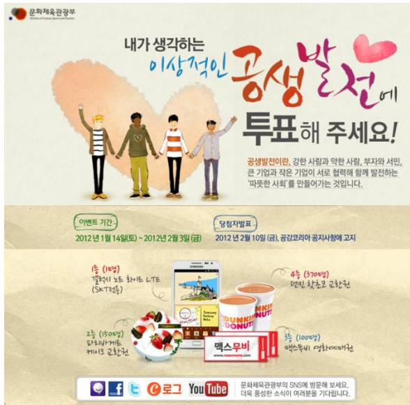
이벤트 내용 고지