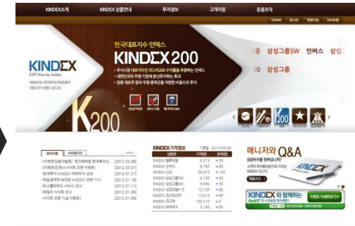
KINDEX 메인페이지로 이동 후 상품 소개 및 가입 유도