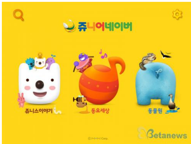
< 쥬니버 태블릿용 App 초기화면 >