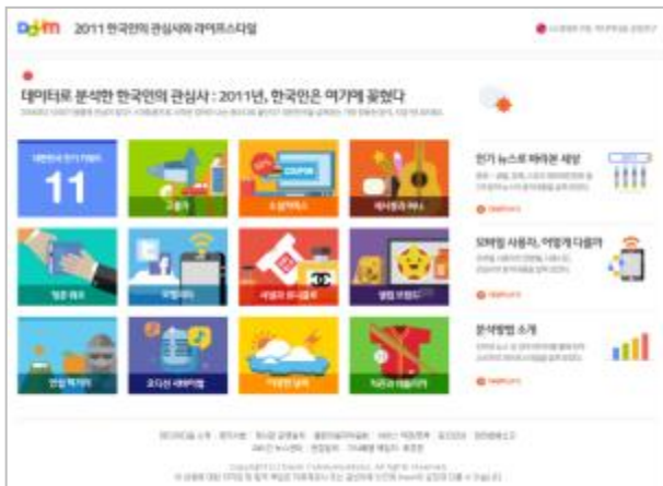
< 2011 한국인의 관심사와 라이프스타일 >

URL : http://media.daum.net/trendreport/2011/