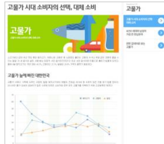
< 예시 페이지(키워드 : 고물가) >

URL : http://media.daum.net/trendreport/2011/