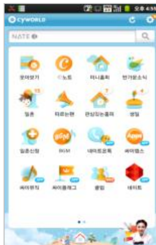
< 싸이월드 모바일 페이지 >