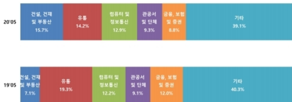
그림1. 2019년 5월 대비 2020년 5월 주요 업종 구성비 변화

2019년 5월 대비 2020년 5월 주요 업종별 구성비 현황을 살펴보면, '건설, 건설 및 부동산' 및 '컴퓨터 및 정보통신', '관공서 및 단체' 업종은 전년 동월 대비 증가하고, '유통', '금융, 보험 및 증권' 업종은 전년 동월 대비 감소하였다.