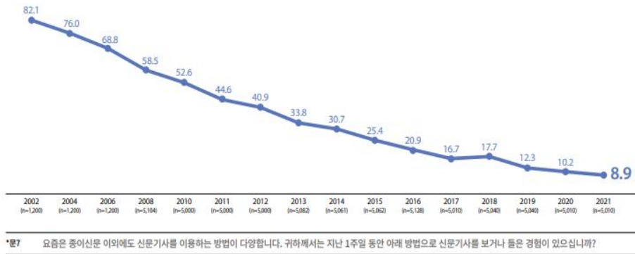
Figure 1. Newspaper readership (2002-2021)