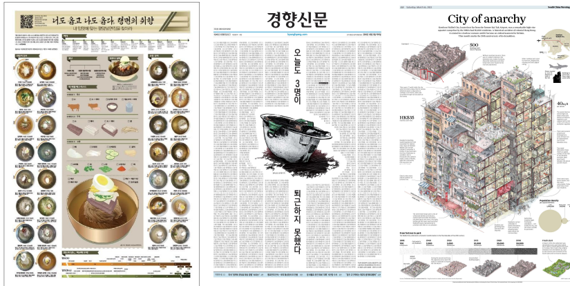
Figure 3. Front-page infographics in Kyunghyang Shinmun and South China Morning Post